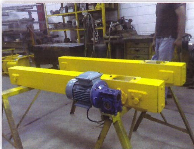
Carros Testereros - Prefabricados y Proyectos Carros Testereros Jgo × 2 und - 2.000Kg