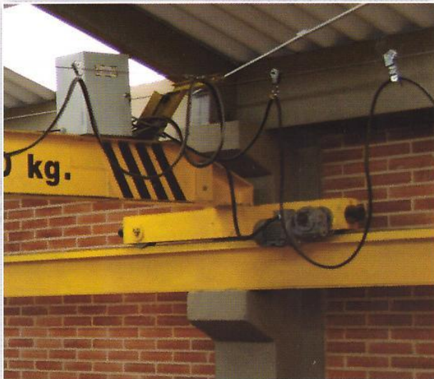
Puente Grúa con Carros Testereros - Dielco Carros Testereros Jgo × 2 und - 2.000Kg