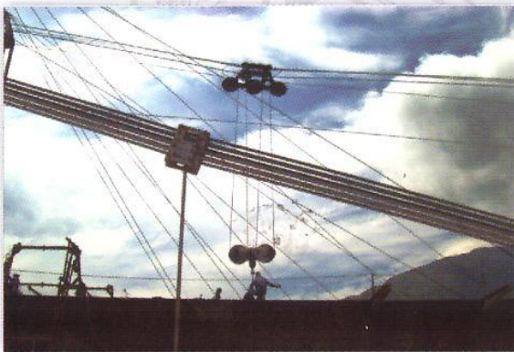
CONCREARMADOS - HB Teleférico - 10.000Kg