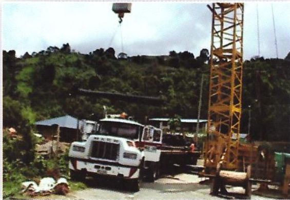
ODINSA - PUENTE ESTAMPILLA Teleférico - 7.000Kg