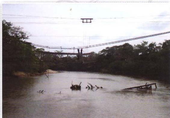
NORTE INGENIEROS Teleféricos - 5.000Kg