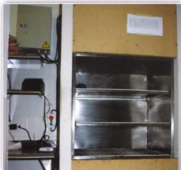
Restaurante Spoleto - Bogotá Montaplatos - Capacidad 100 Kg