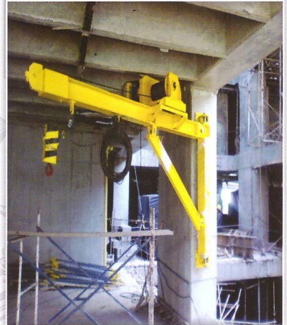
Construcciones Torre Agua S.A.S Capacidad 700 Kg - Altura de Izaje 25 mts