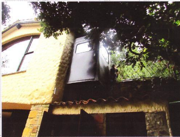
Inversiones Sayba - Bogotá Ascensor de Discapacitados - 200Kg